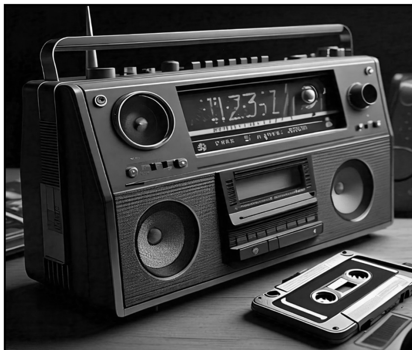
[Mothopo: Meta AI]